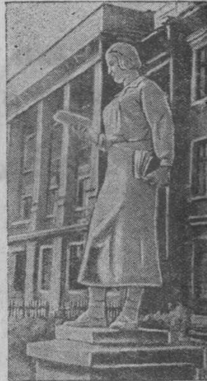
Гор. Сталинск НА СНИМКЕ: скульптурная фигура студентки, установленная у учительского института.

В Сталинске по решению Новосибирского облсполкома организуется специальная дежурная камера народного суда. В ней будут рассматриваться дела хулиганов, не требующие предварительного расследования. Хулигана, приведенного в милицию, будут судить сразу же после совершенного им хулиганского поступка. Сталинскому горисполкому предложено в суточный срок подобрать помещение для камеры. Дежурная камера будет организована при 4-м отделении милиции. На-днях она приступит к работе.