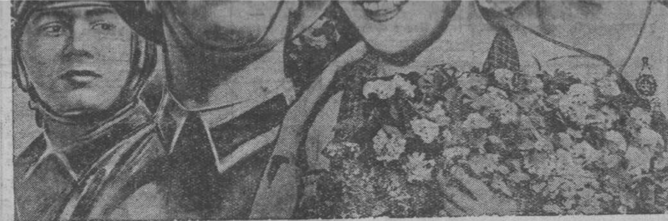
Фотомонтаж А. Юргенс.

Да здравствует наш любимый учитель и друг, вождь народов товарищ Сталин!