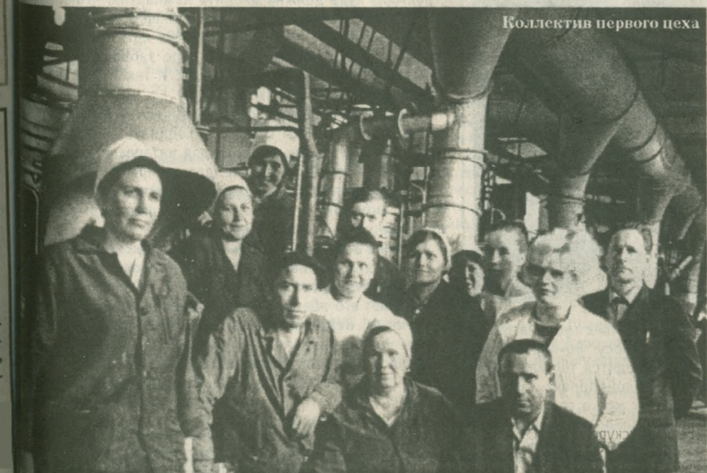
Коллектив первого цеха

Марка предприятия хорошо известна в стране и за рубежом, она по достоинству оценена деловыми партнерами.