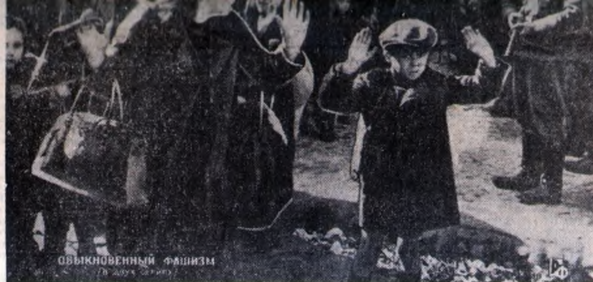
Кадр из фильма «Обыкновенный фашизм».