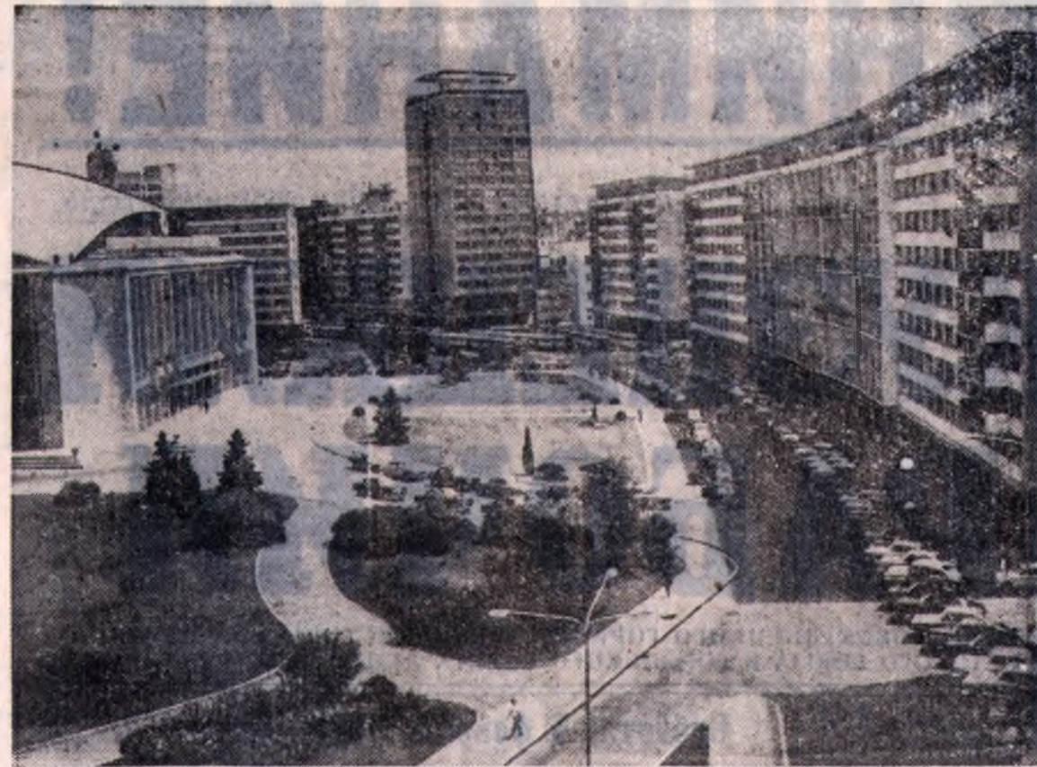
Исполнилась 18-я годовщина со дня подписания Договора о дружбе, сотрудничестве и взаимной помощи между Советским Союзом и Социалистической Республикой Румынией.

Кузнецкая крепость была не одиока — она входила в Колывано-Кузнецкую укрепленную линию, созданную в 1747—1768 годах и тянувшуюся от Усть-Каменгорской крепости до Илецкой палаты. В 1768 году