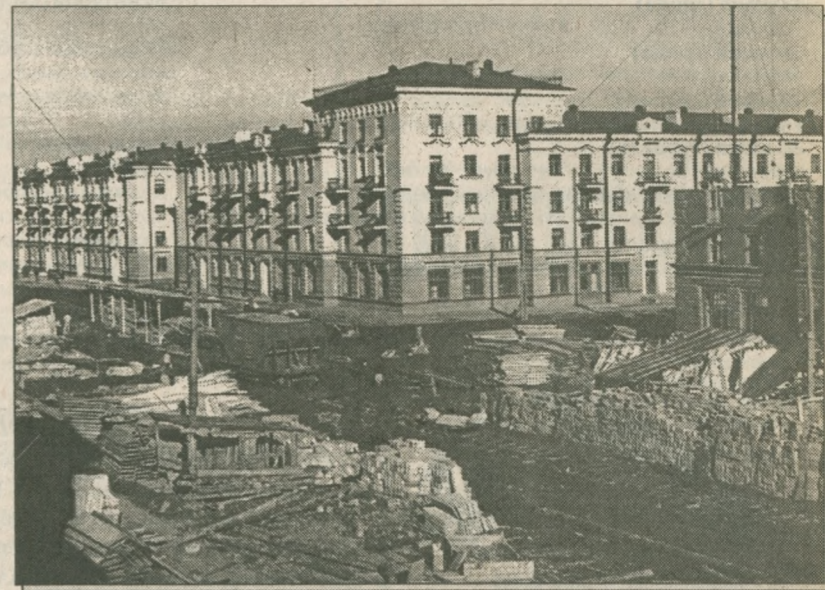
Угол проспекта Metallurgov и улицы Ушинского. Конец 40-х - начало 50-х годов.

Кончилась война. Знамя Победы вызвало к жизни прилив новых творческих сил всего народа. Архитекторы всей страны искали новую победную торжественную архитектуру. Из руин вставали еще бо-