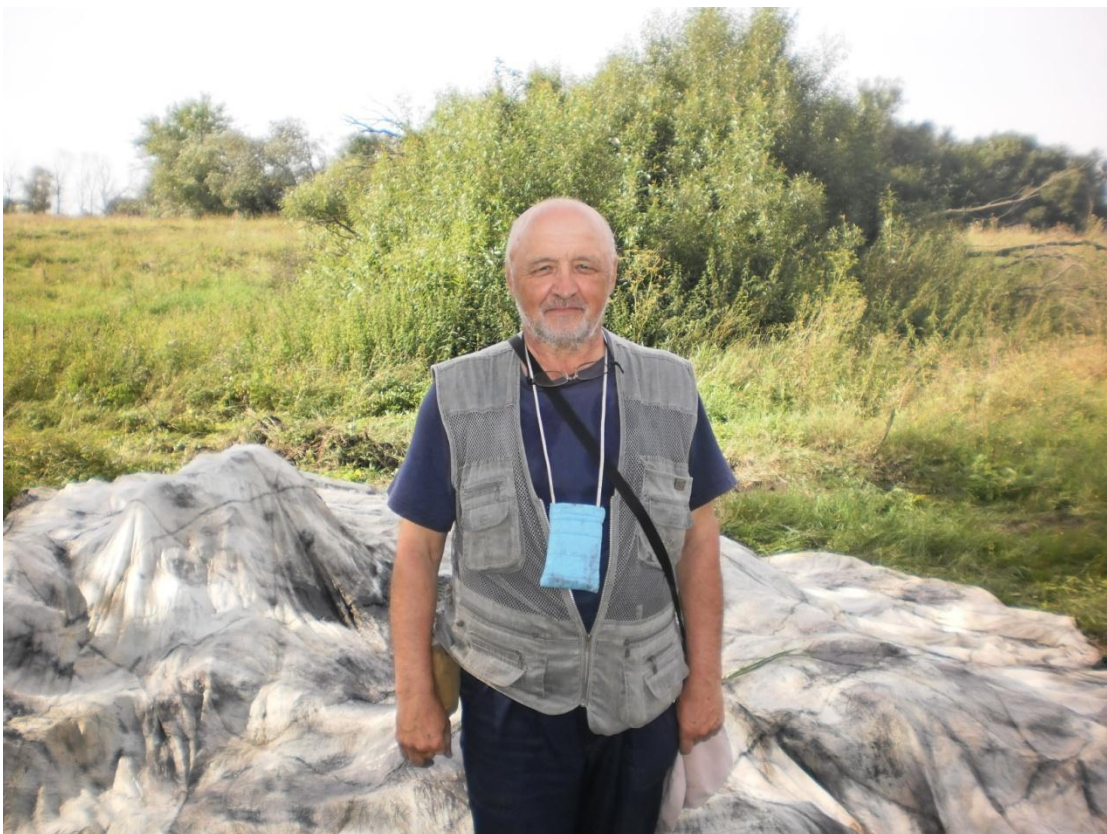
На фоне поднятого парашюта ПЛ-3М № 021124 изготовленного 21.04.1941 года