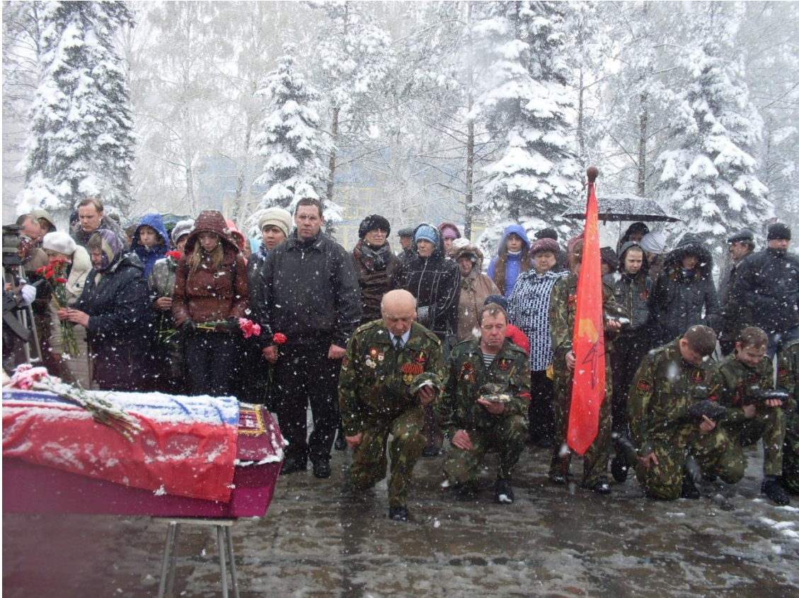
г. Киселёвск 201 год. Захоронение найденных останов