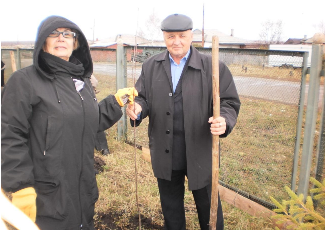
Участие в посадке деревьев и кустарников