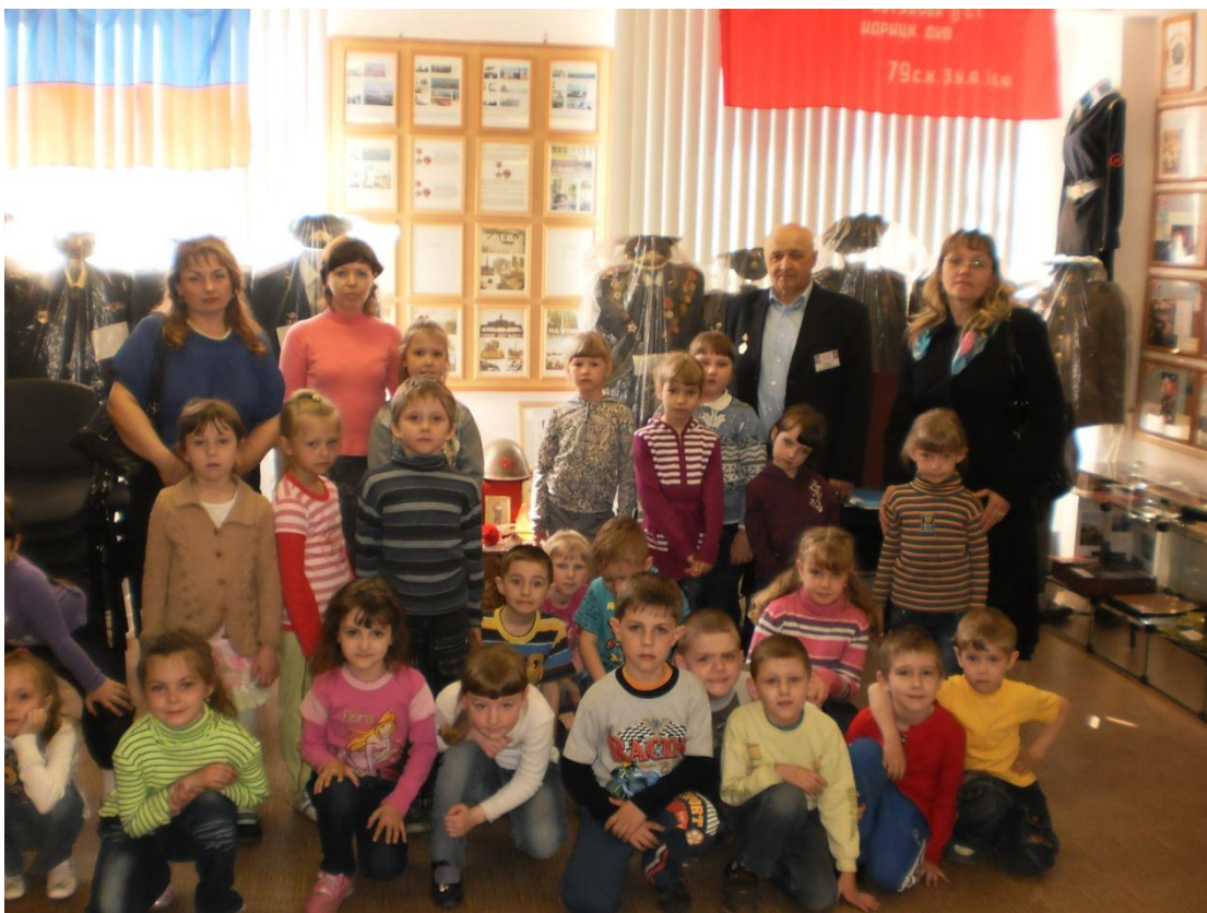
Экскурсия для детей детсада 7 мая 2011 года