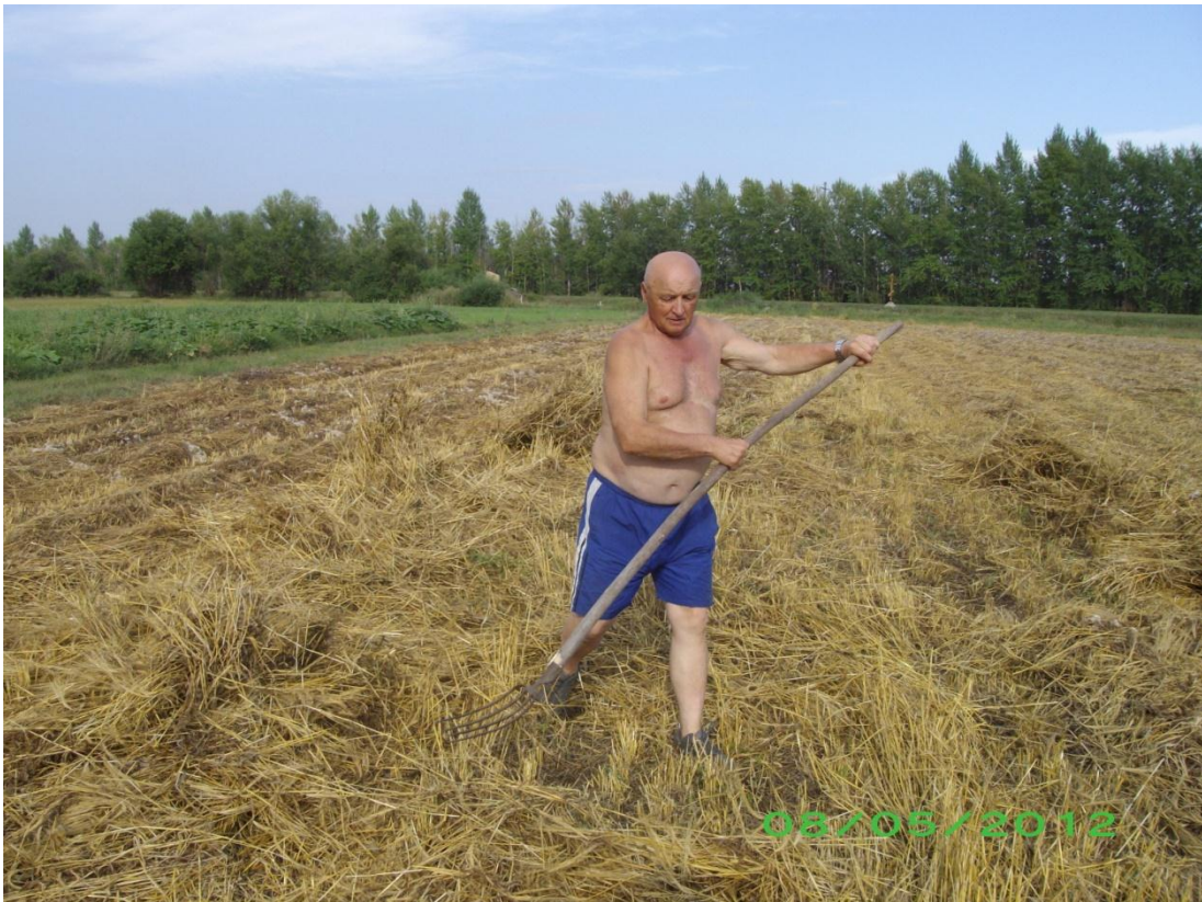
Село Озерки. Оказание волонтерской помощи в уборке