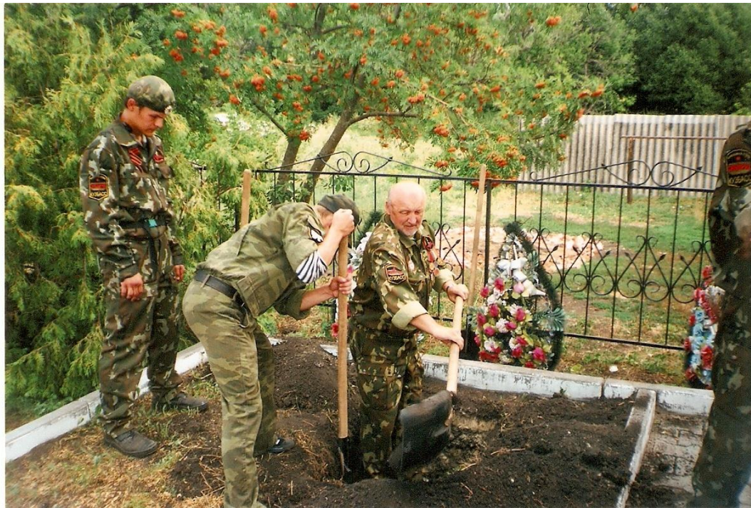
2010 год Озерки. Копка могилы для захоронения найденных останков