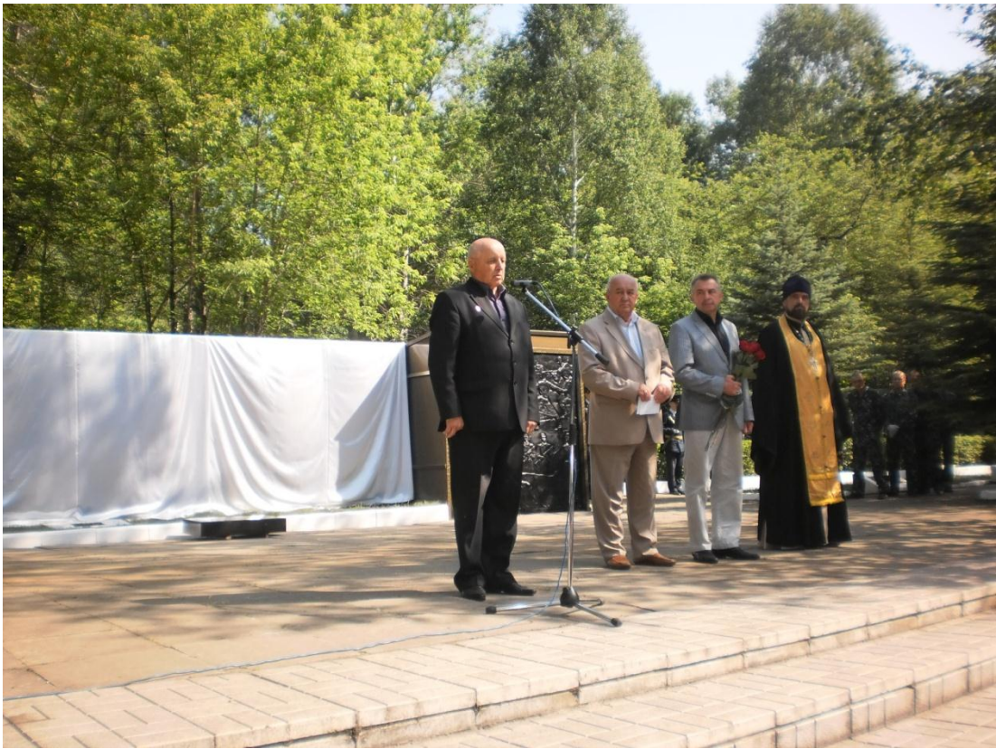
Выступление на митинге