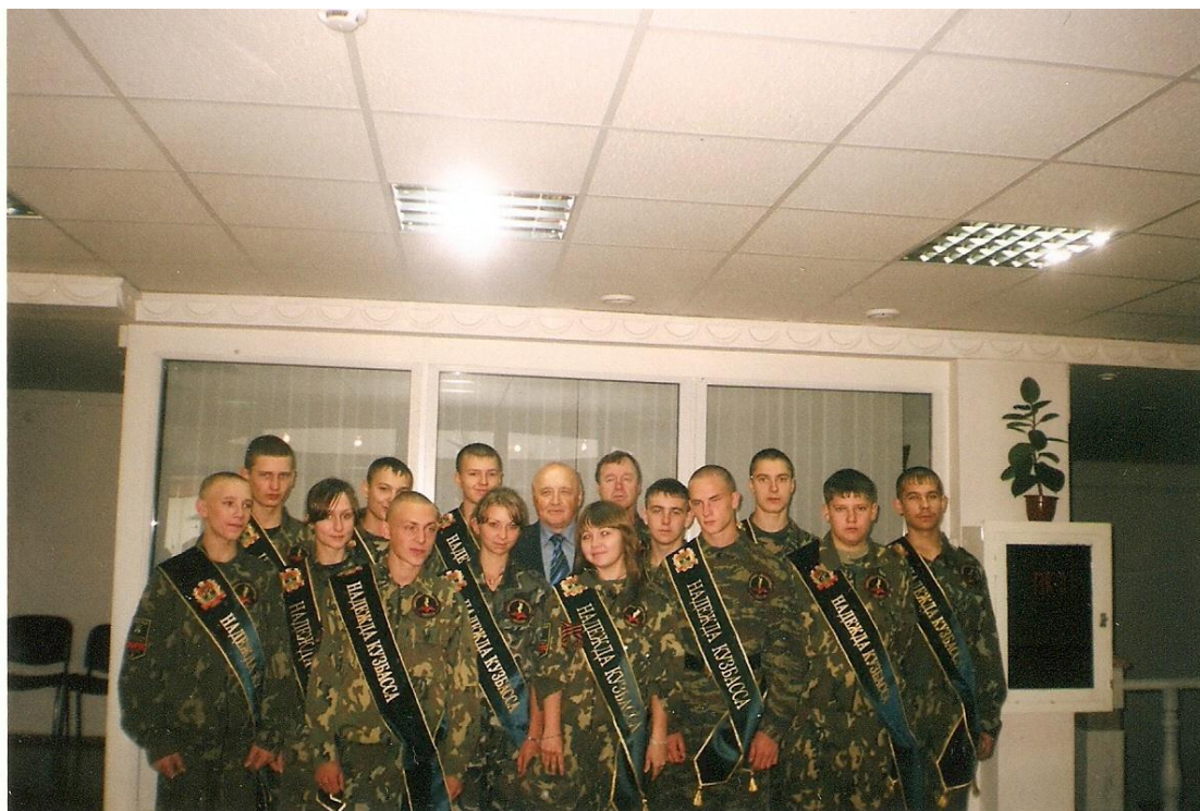
Август 2011 год. Награждённые поисковики отряда «Сибиряк»