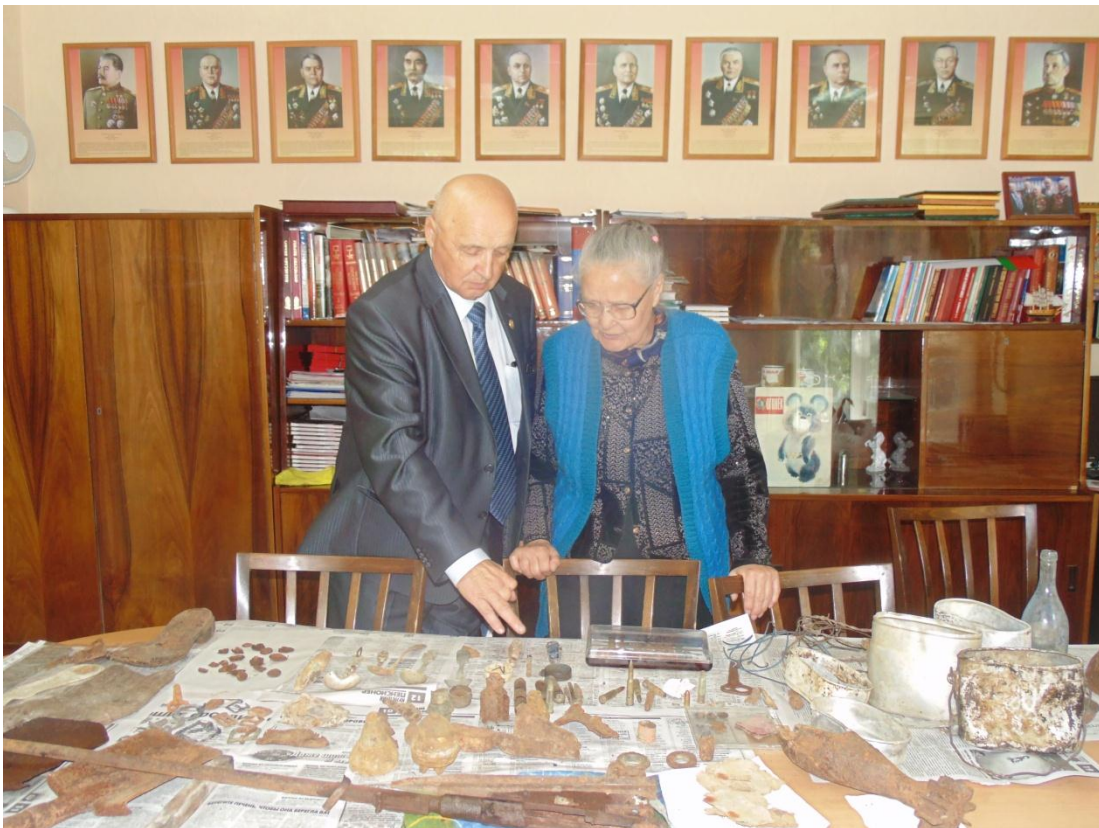
Экскурсия для гостей из Казахстана. 2016 год.