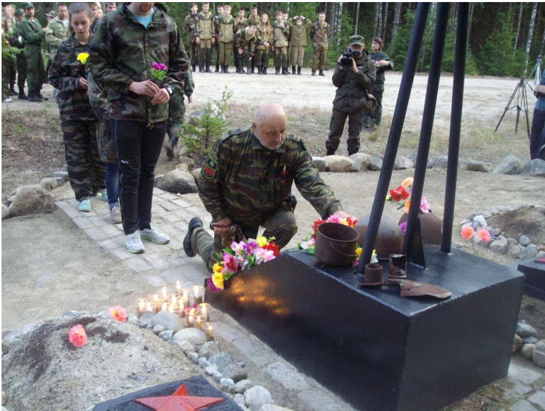
Возложение цветов на братскую могилу 69 омсб