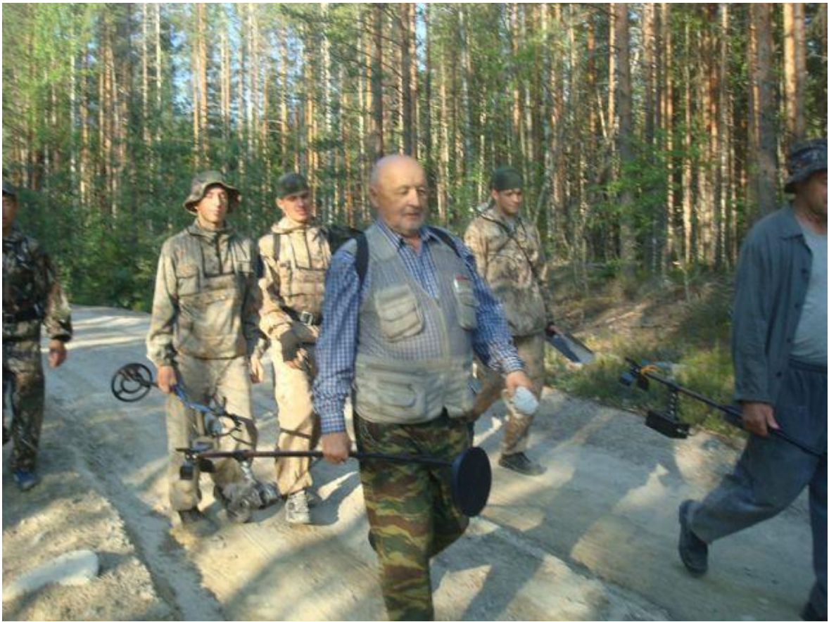
Карелия. Выдвижение в район поиска