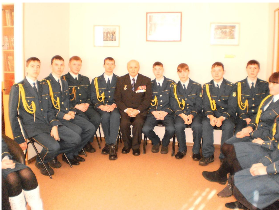
Встреча с часовыми поста № 1