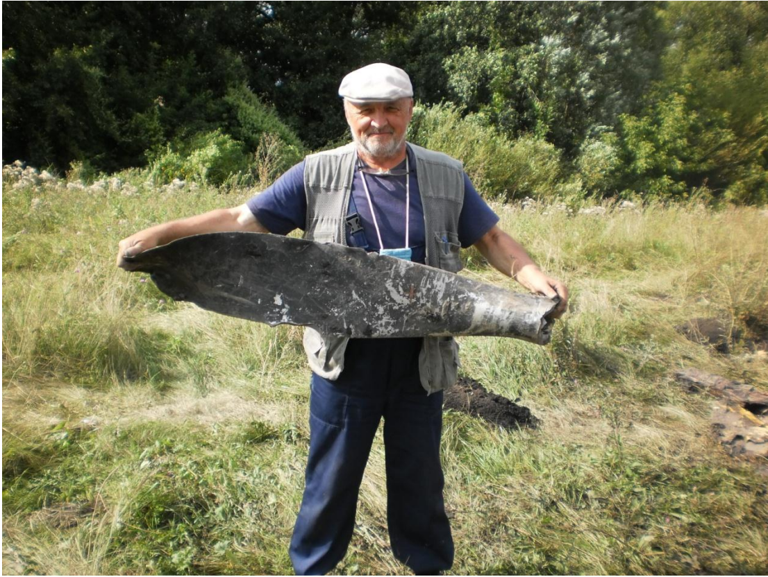
Лопасть от винта самолёта ЛАГ