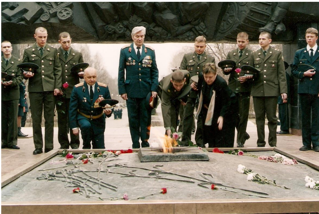
Возложение цветов с военнослужащими Президентского полка