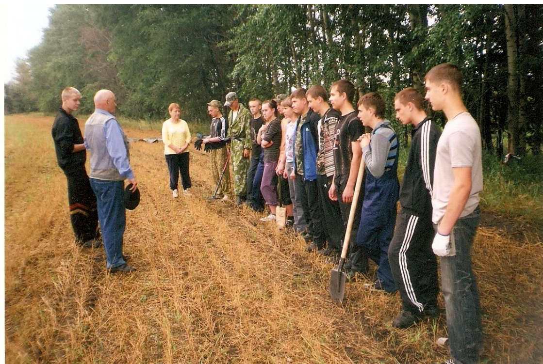
Инструктаж по технике безопасности. с. Озерки август 2012 года