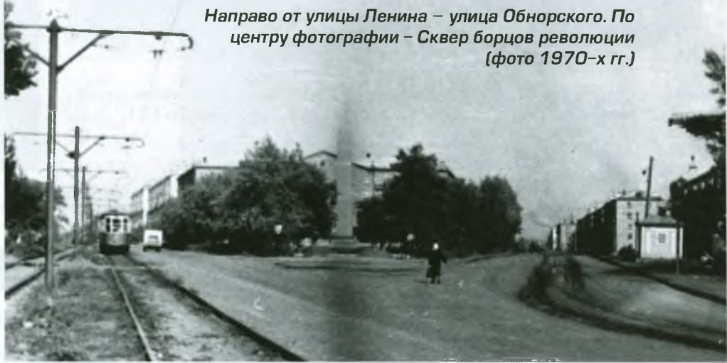
Направо от улицы Ленина – улица Обнорского. По центру фотографии – Сквер борцов революции (фото 1970–х гг.)

Виктор Павлович Обнорский – один из первых революционеров в Российской империи, руководитель первых политических рабочих организаций в стране. В конце 1872 года он вошёл в народнический кружок «чайковцев», который в конце 1873 года был разгромлен. Обнорскому удалось скрыться и переехать в Одессу. Там он познакомился с организатором «Южно-Российского союза рабочих» Е.О. Заславским. В 1874 году Обнорский уехал за границу, где узнал особенности европейского рабочего движения, усвоил социал-демократические принципы. В Россию вернулся с идеей создания в Петербурге политической рабочей организации наподобие организации Заславского. Однако в 1879 году он был арестован и осужден на 10 лет каторги, которую отбывал в Забайкалье. С 1909 года Виктор Павлович жил в Кузнецке под надзором полиции. Здесь Обнорского знали как хорошего мастера-вожого: он чинил примусы, ружья, кастрюли. Вокруг него сплотились прогрессивно настроенные люди Кузнецка, которые часто собирались для бесед в его мастерской. Умер революционер в 1919 году после продолжительной болезни. Сегодня бюст В.П. Обнорского стоит в начале улицы, в Сквере борцов революции.