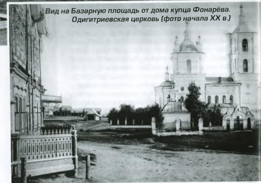
Вид на Базарную площадь от дома купца Фонарёва. Одигитриевская церковь (фото начала XX в.)

Начинался Кузнецк площадью, которая раньше называлась Базарной (ныне Советской) и была деловым центром города. Оформилась она к середине XIX в. На площади находились крупнейшие ма-