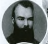
В. П. Обнорский С. М. Халатурин организатор «Северного союза русских рабочих»