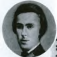
Е. О. Заславский организатор «Южно-Российского союза рабочих»