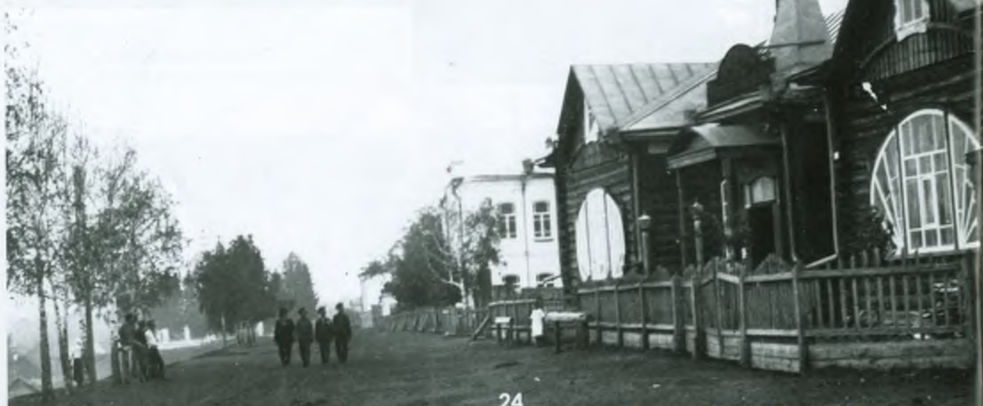
Народный дом им. А. С. Пушкина (фото 1917 г.)