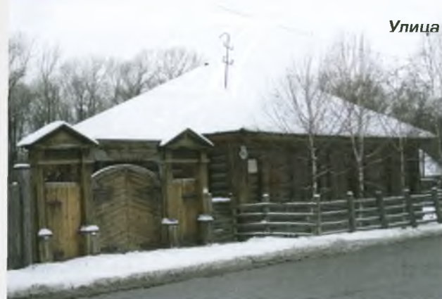
Улица и Дом-музей Ф. М. Достоевского.