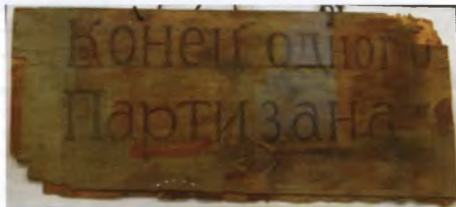
Александр Чекалин. Доска, которую фашисты повесили А. Чекалину на грудь перед казнью

на работу в Москву начальником Главалюминстроя. До последних дней своей жизни он поддерживал связь с заводом.