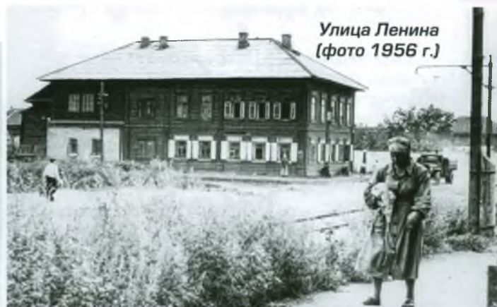
Улица Ленина (фото 1956 г.)

Успенская церковь, построенная в начале XIX в., а при ней имелось кладбище. Собственно, здесь и была окраина города Кузнецка. В революционные годы «борьбы за власть» церковь изрядно пострадала, а затем ее разрушили окончательно. В 1930-е годы кладбище перенесли на гору, так как этот квартал вошел в проект застройки Кузнецкого района.