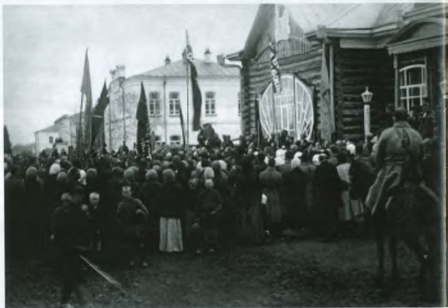
Митинг кузнецчан у Народного дома по случаю Февральской революции (фото 1917 г.)