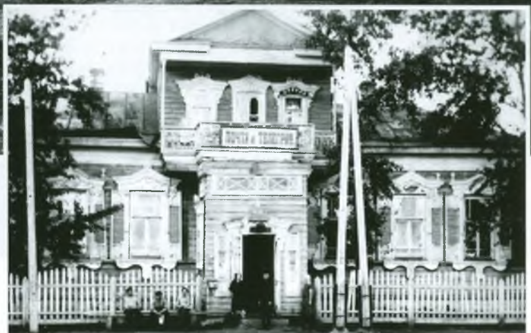
Здание почты и телеграфа (фото второй половины 1920-х гг.)

Опоясывали площадь храмы – Преображенский собор, который освящает Кузнецкую землю до сих пор, и Одигитриевская церковь, разграбленная и сожжённая в 1919 году, но навсегда вошедшая в историю днём венчания в ней Фёдора Михайловича Достоевского и Марии Дмитриевны Исаевой. Поэтому не удивительно, что с площади мы попадаем на улицу Достоевского. Это одна из старейших улиц Кузнецка. Сначала она называлась Большой, так как на ней строились самые большие и богатые дома. Позже её переименовали в Полицейскую из-за расположенной здесь управы. В 1901 году улица получила современное название, в честь великого классика, проведшего в Кузнецке 22 дня. Отбывая солдатскую службу в Семипалатинске, писатель несколько раз приезжал в Кузнецк для встреч со своей возлюбленной Марией