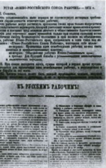
Устав «Южно-Российского союза рабочих». 1875 г. Программа «Северного союза русских рабочих». 1879 г.