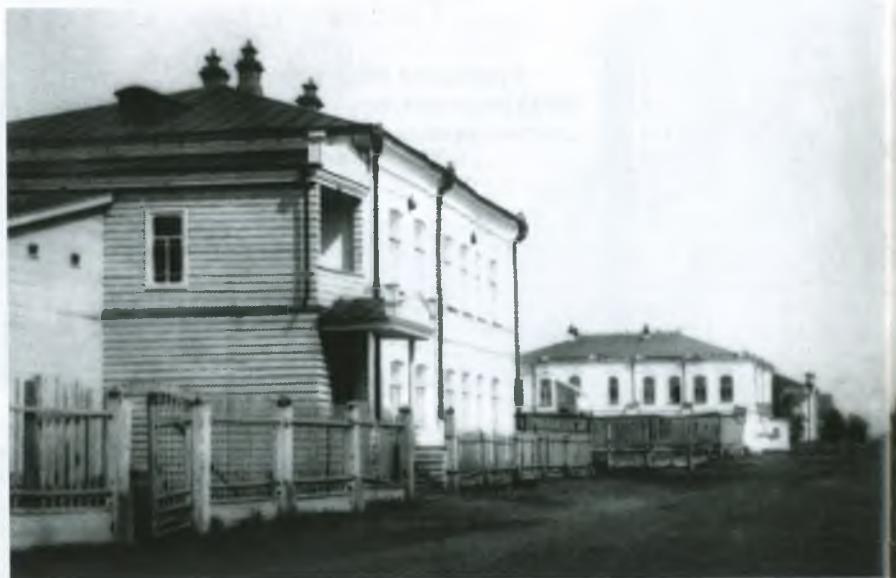
Общий вид на улицу Нагорную (фото 1890-х гг.)

Не секрет, что в тот период в чести были революционные деятели, чьи имена увековечивали в названиях. Так появилась