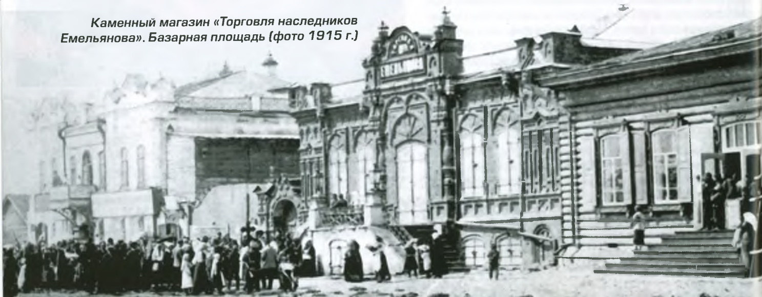
Каменный магазин «Торговля наследников Емельянова». Базарная площадь (фото 1915 г.)

Почта и телеграф — одно из самых примечательных зданий деревянной архитектуры Старого Кузнецка. Своим фасадом дом выходил на Базарную площадь. Усадьба располагалась вдоль Базарного переулка, переименованного позже в улицу Ленина. Перво-