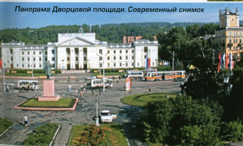
Панорама Дворцовой площади. Современный снимок