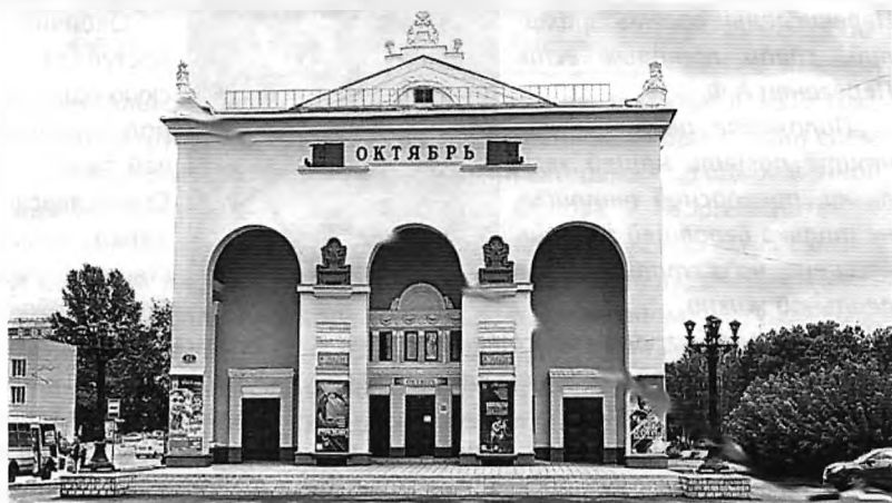
Сегодня это единственный из муниципальных действующих кинотеатров Новокузнецка.