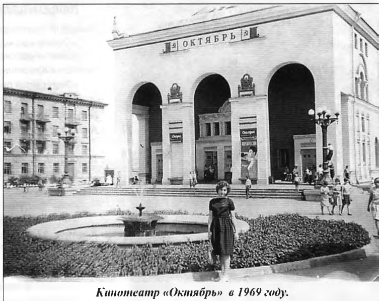
Кинотеатр «Октябрь» в 1969 году.

Поначалу в «Октябре» работали на советском оборудовании КН-23. Чтобы обеспечить непрерывный показ полнометражных фильмов, использовали два одинаковых кинопроектора, каждый из которых называли